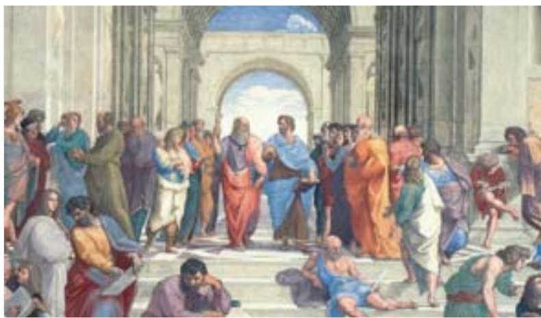
Si les pistes de réformes envisagées par le gouvernement aboutissent, le moindre accident de carrière se paiera au prix fort. La solidarité nationale ne serait-elle qu'un vain mot ?

Une bonne réforme serait donc de faire converger les régimes et de garantir le niveau relatif des retraites. Cela supposerait une hausse limitée du poids des retraites dans le PIB. Au contraire, le but d'Emmanuel Macron est de réfor-