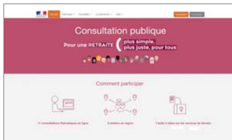
Bien qu'affichant des objectifs de simplicité, de justice et d'égalité sur la Une de son site de consultation publique, le gouvernement s'attaque méthodiquement aux mécanismes de solidarité.

Le SNES-FSU de Grenoble publie un décryptage complet de la consultation : https://grenoble.snes.edu/projet-de-reforme-des-retraites-lhtml