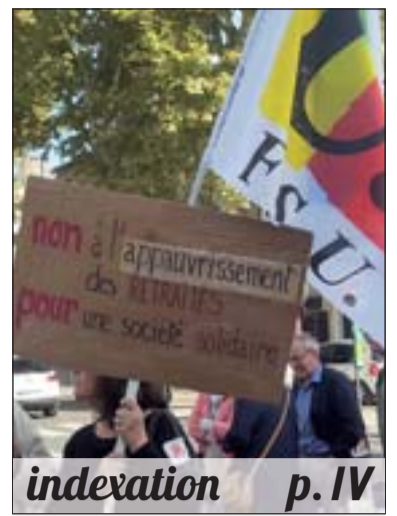
indexation p. IV

L'Université Syndicaliste, le journal du Syndicat national des enseignements de second degré — numéro 781 du 22 septembre 2018