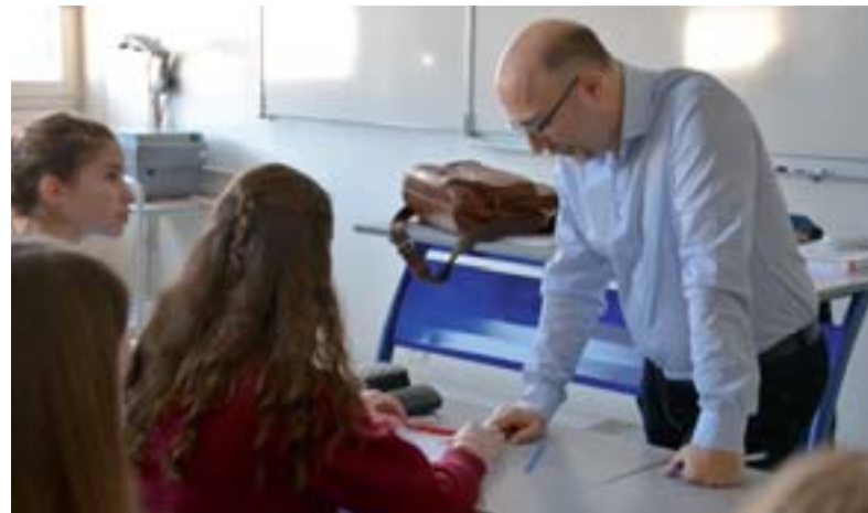
Professeurs, CPE, Psy-ÉN : à des rémunérations peu attractives s'ajoutent des menaces sur les pensions.

Le comité de suivi des retraites (CSR) dans son rapport de juillet 2016 (avant le projet radical de Macron) avait déjà précisé qu'en appliquant les règles de liquidation des salariés du régime général à des cas-types de fonctionnaires présentant des structures de rémunérations différentes, les enseignants aux rémunérations relativement basses en début de carrière et aux taux de primes très faibles, seraient