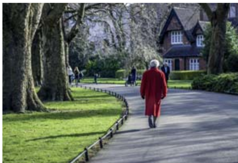
Les femmes sont les principales bénéficiaires des pensions de réversion. Les hommes ont plus souvent des revenus qui dépassent les plafonds de ressources.

► Dans la Fonction publique : la pension de réversion équivaut à 50 % de la pension perçue par le conjoint décédé. Aucune condition d'âge ni de ressources mais des conditions de durée du mariage (deux ans minimum). Le versement est interrompu en cas de remariage, PACS, concubinage.