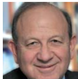
Henri Sterdyniak est économiste, membre de l'Observatoire français des conjonctures économiques (OFCE) et coanimateur des Économistes Atterrés.

qui suppose aussi une réflexion sur les besoins sociaux en matière d'emplois dans les secteurs de l'éducation, de la santé, de la dépendance, de la culture, de la transition écologique. ■