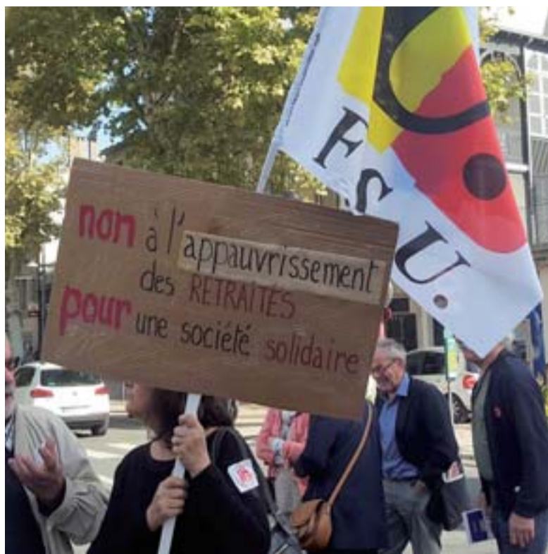
Les retraités font-ils partie d'une « génération dorée » comme l'affirme Eric Alauzet, député LREM du Doubs, quand la pauvreté touche 7,6 % d'entre eux ?

Les retraités sont pourtant performants dans leurs fonctions sociales (solidarité et transmission entre générations, bénévolat associatif – y compris auprès des réfugiés, ce qui doit