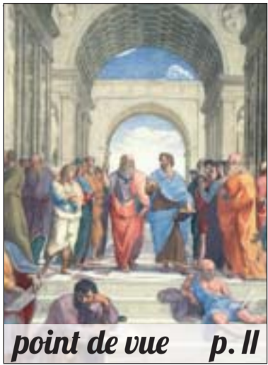
point de vue p. II